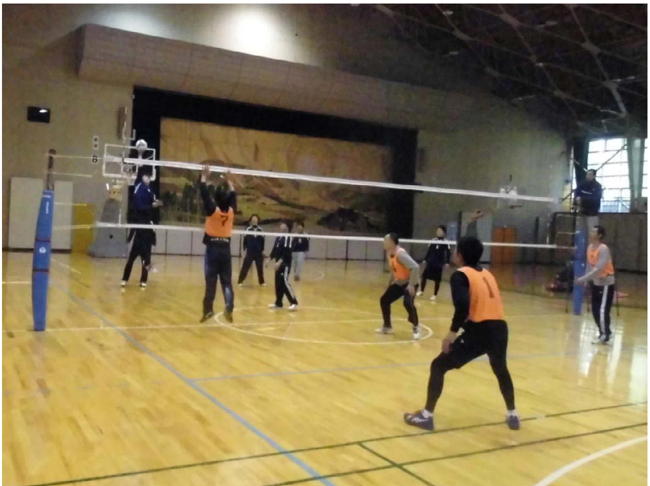
第44回葛巻町民6人制バレーボール大会より (11月6日、葛巻町社会体育館)