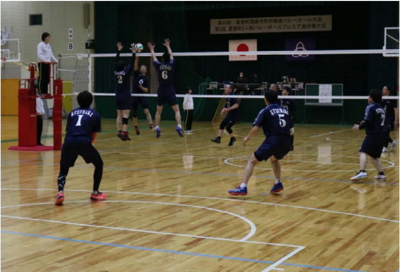
第40回葛巻町隣接市町村親善バレーボール大会・ 第3回葛巻町6人制バレーボールプレミア選手権大会より (3月10日、葛巻町社会体育館)