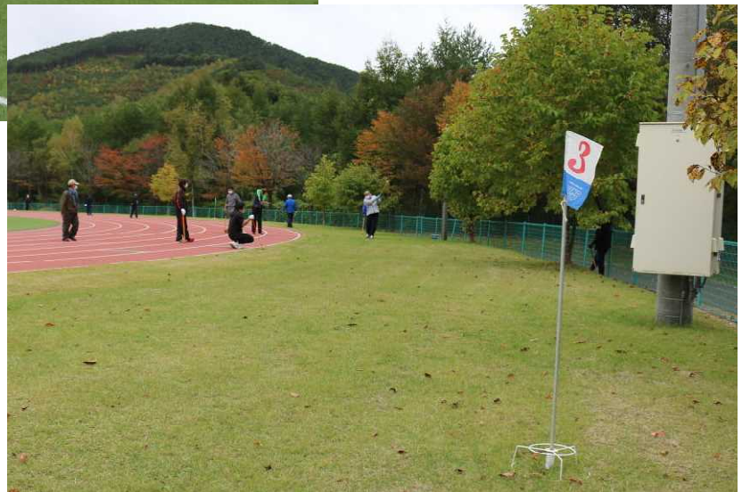
第36回葛巻町総合体育大会中期競技 第28回葛巻町民スポーツ・レクリエーション祭より (10月11日、葛巻町総合運動公園)