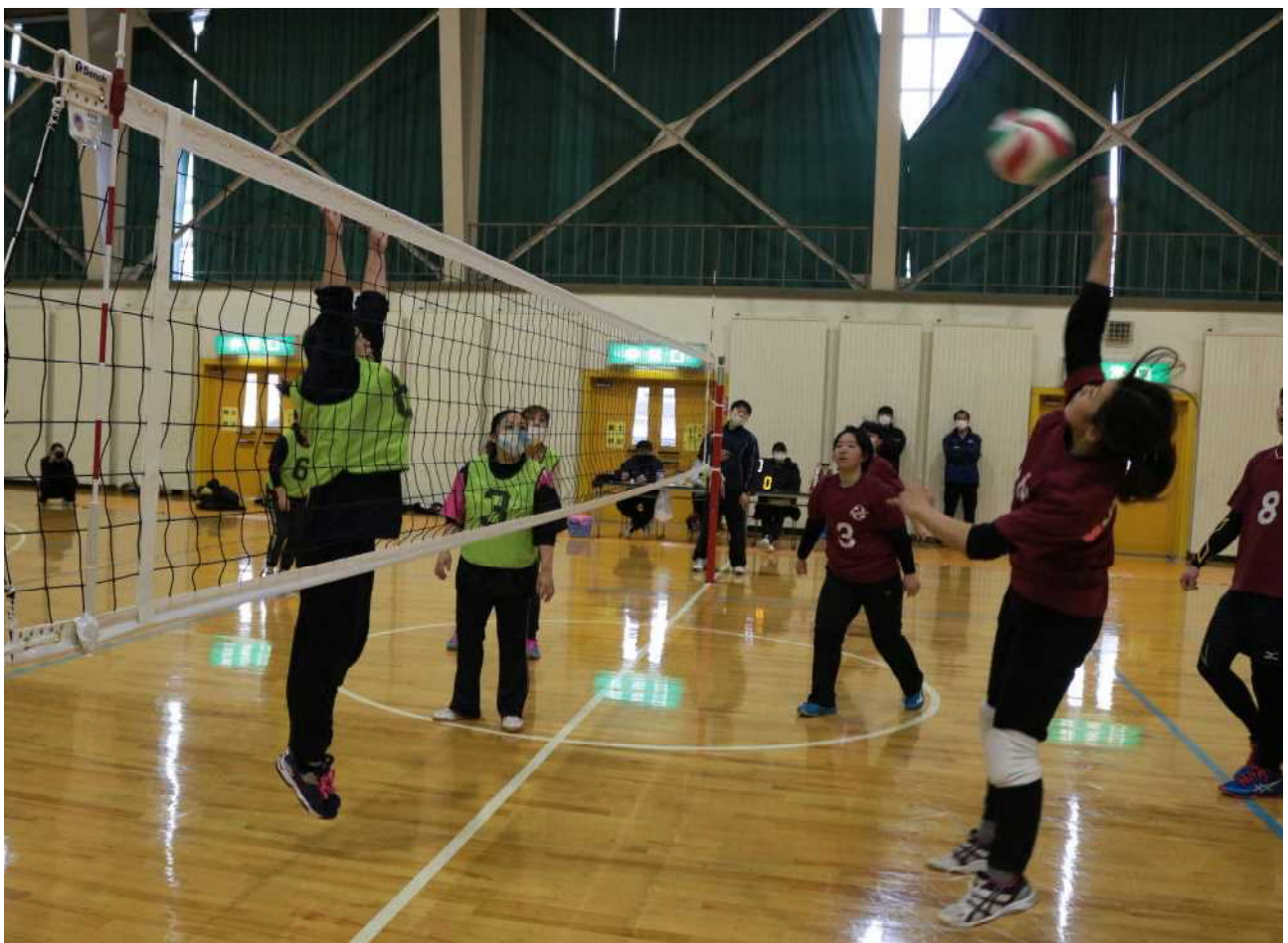
第48回葛巻町民9人制バレーボール大会より (12月13日、葛巻町社会体育館)