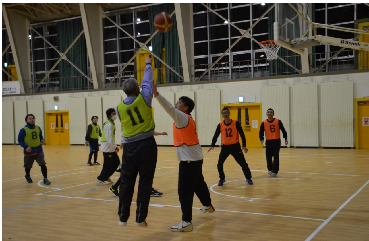
第48回葛巻町民バスケットボール大会より (3月7日、葛巻町社会体育館)