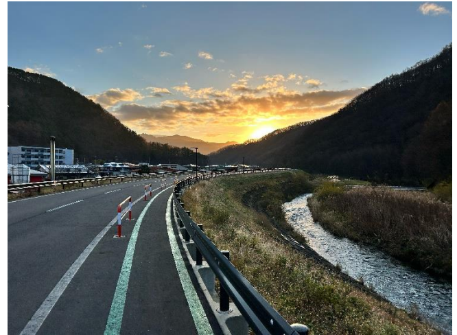
↓朝の散歩中の景色に感動