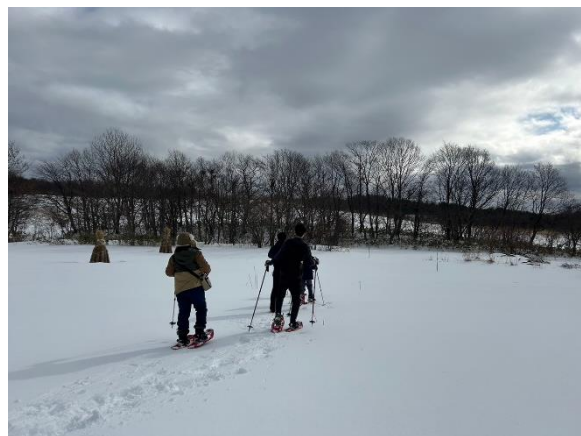
↑先日北上にてスノーシューを装着してのトレッキングを体験してきました。

皆さんも来月は進学・就職・転勤・転職など様々な環境の変化がある月になるかと思っておりますので2月のうちに運動習慣をゲットしましょう!